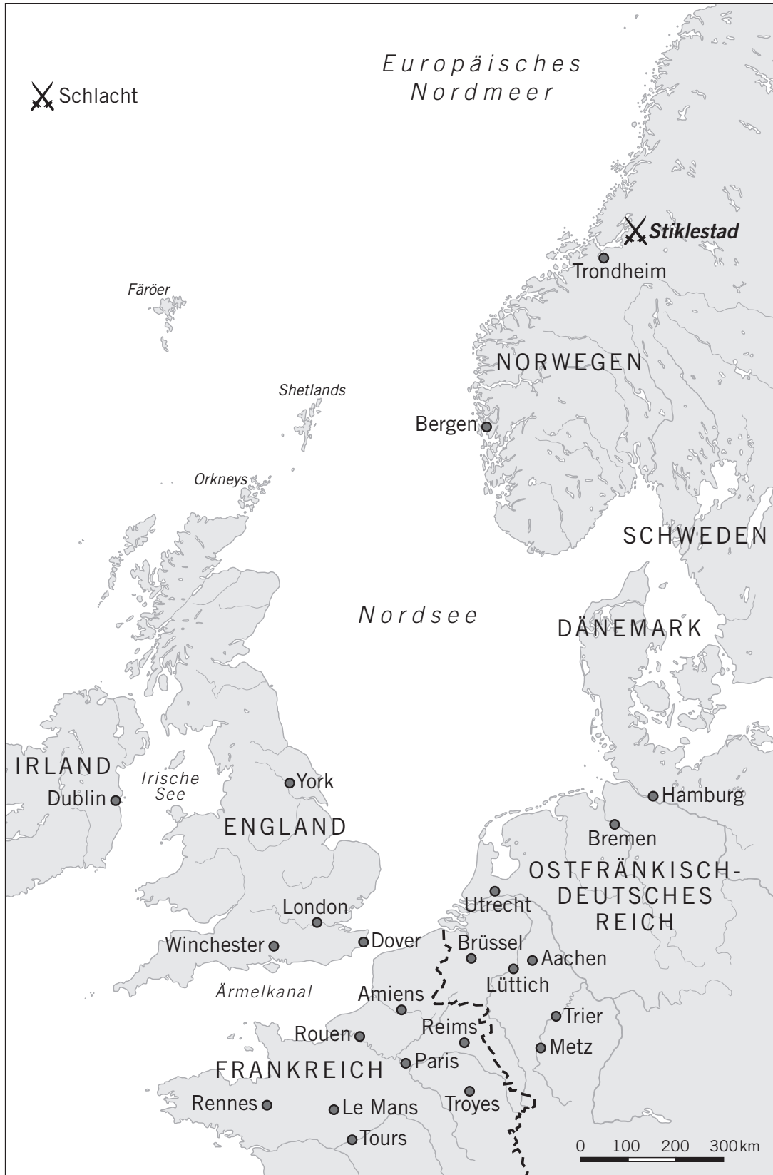
Karte 1 Der Nordseeraum