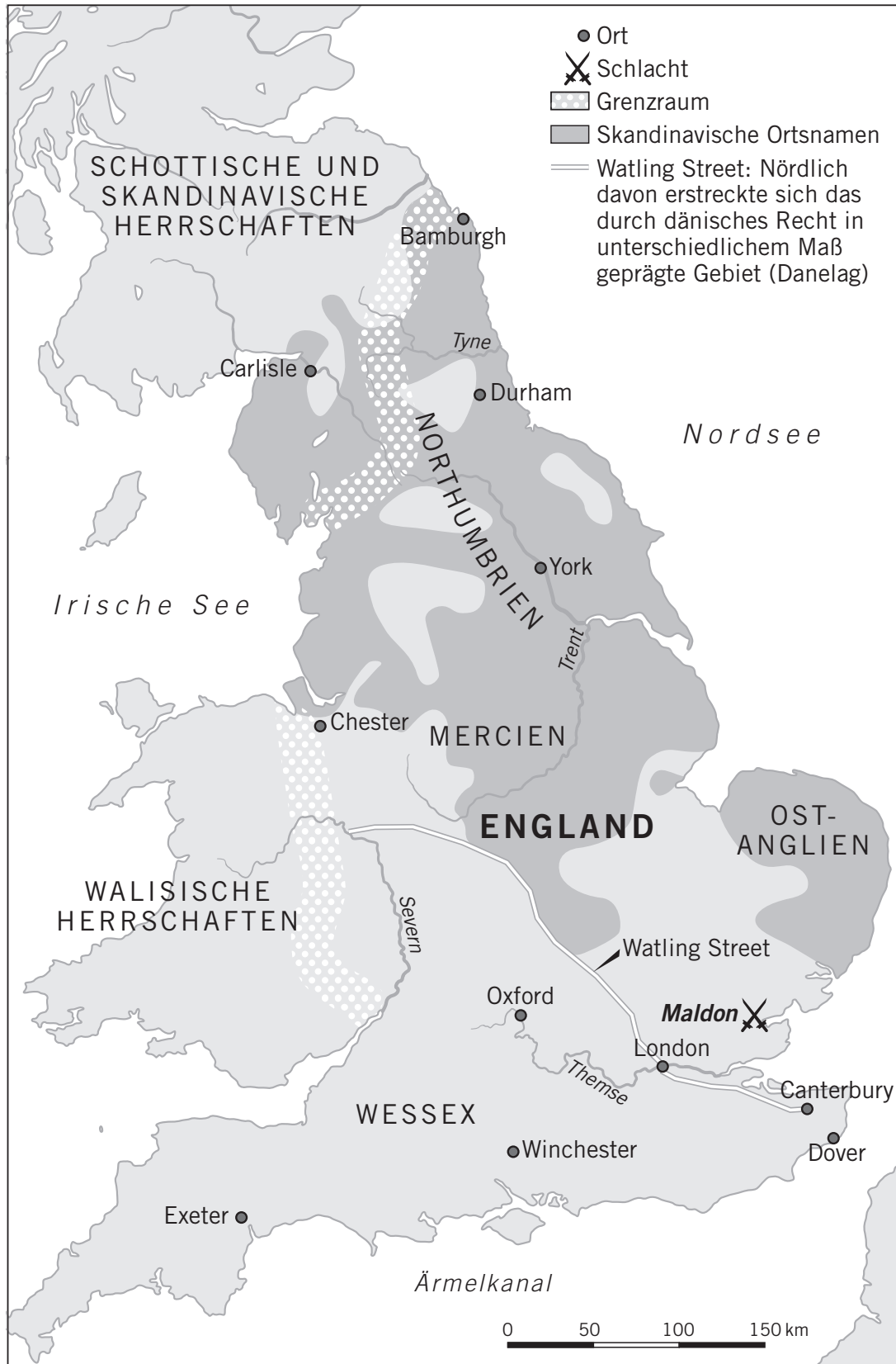
Karte 2 Großbritannien um 1000